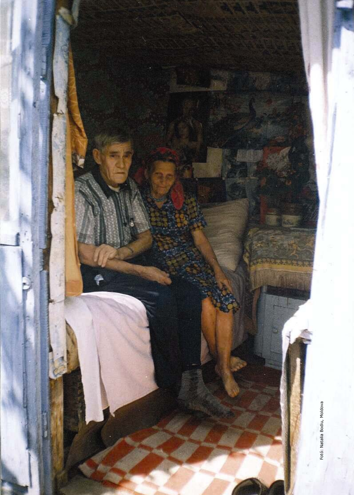
Fotó: Natalia Bodiu, Moldova